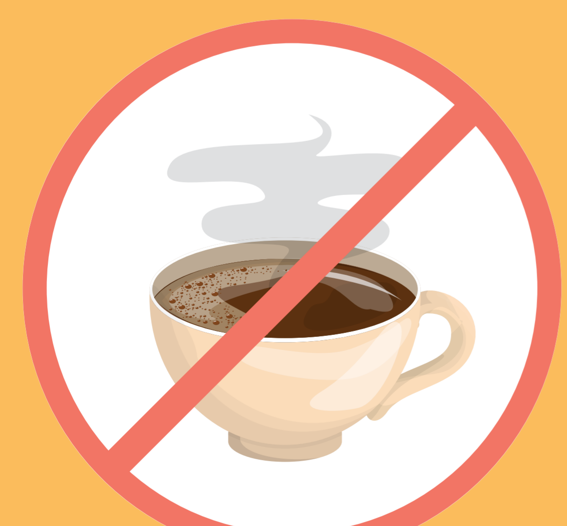
Nepít příliš kávy