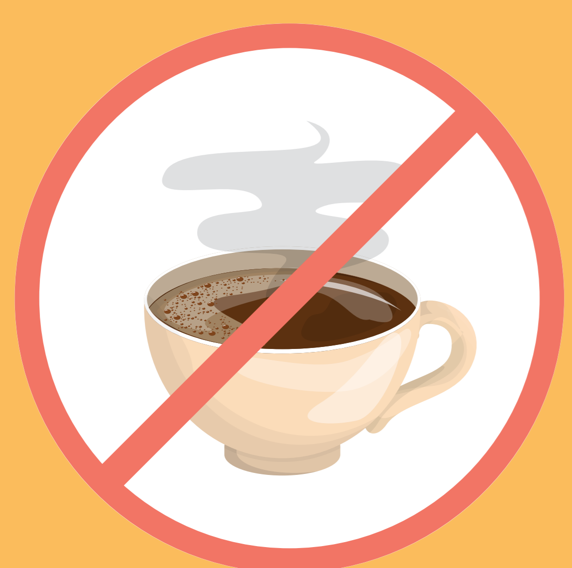
Nepít příliš kávy